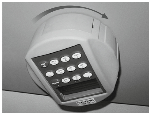
Şifre giriři / Introducerea codului / Wprowadzenie kodu / Zadání kódu