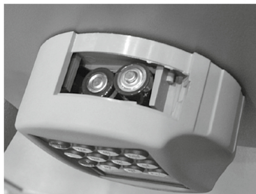
Piller / Baterii / Baterie: 2x 1,5V Mignon (LR6)